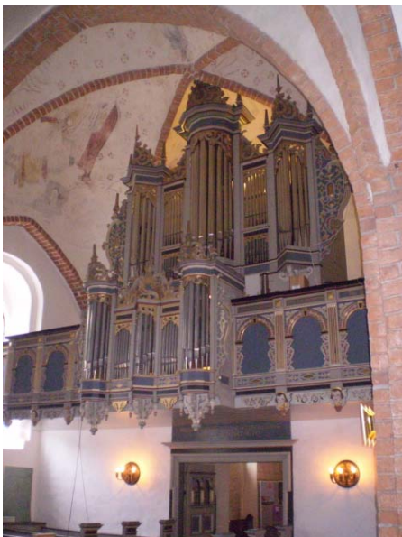
Fakse Kirkes tomme rygpositiv. Svelleværket er bygget ind bagerst i et tårnrum

HS. I Fakse Kirke valgte man ikke at bruge facadens rygpositiv som nu står gabende tomt. Derimod blev der lavet et svelleværk placeret bag ved hovedværket. Vil vi nogensinde igen se nye orgler med HV + RP UDEN svelleværk, og er brystværkernes tid forbi?